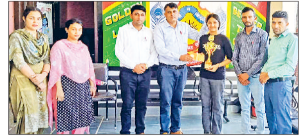
कैथल। अबल रहे गोल्डन स्कूल के विद्यार्थी।

बातचीत कर समय बिताती हैं। ग्रामीणों का कहना है कि आज के युवाओं को उनसे प्रेरणा लेनी चाहिए। उनका जीवन इस बात का उदाहरण है कि सादा जीवन, संतुलित आहार और सकारात्मक सोच इंसान को लंबी और स्वस्थ जिंदगी दे सकती है। गांव में यह बुजुर्ग महिला सभी के लिए सम्मान और प्रेरणा का केंद्र बनी हुई हैं। लोग अक्सर उनसे मिलने आते हैं और उनका आशीर्वाद लेते हैं। महिला को 100 साल पहले की सभी बातें आज भी यादासत हैं यादासत बिल्कुल भी कमजोर नहीं हुईं यह भी एक बहुत बड़ी बात है।