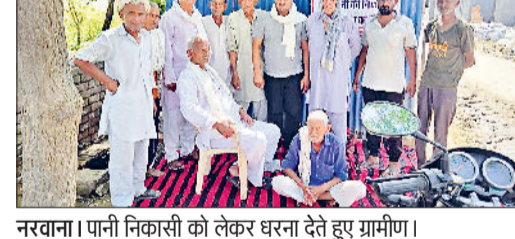
नरवाना। पानी निकासी को लेकर धरना देते हुए ग्रामीण।