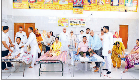
जीद। शिविर में फिजियोथेरेपी करवाते हुए श्रद्धालु।