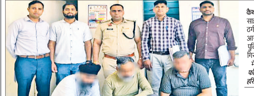
कैथल। साइबर ठगी के आरोपी पुलिस गिरफ्त में।