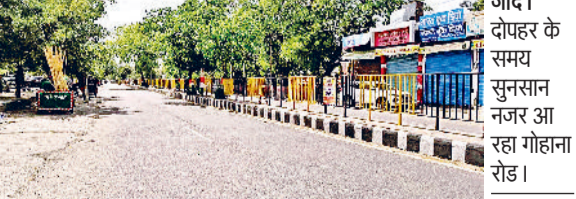
जींद। दोपहर के समय सुनसान नजर आ रहा गौहाना रोड।